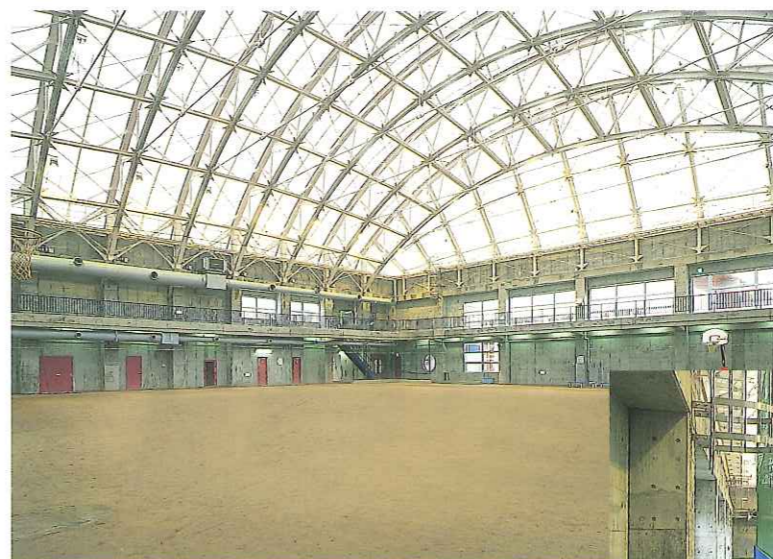
4 屋内運動場 冬期間、土の上で スポーツが楽しめます。