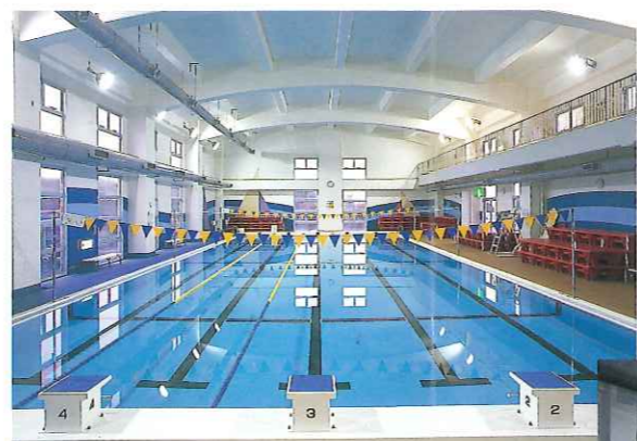
3 室内温水プール 幼児用プールもあり、 室温・水温ともに 約30℃に保たれています。