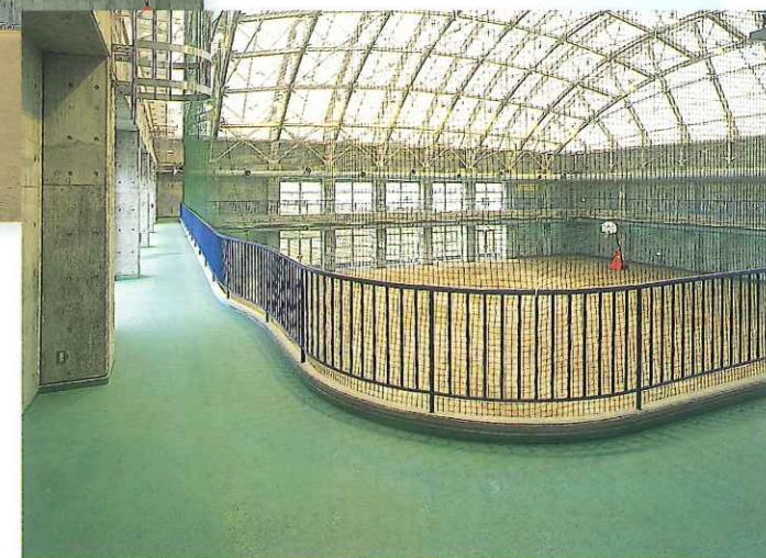
7 屋内運動場ランニングコース