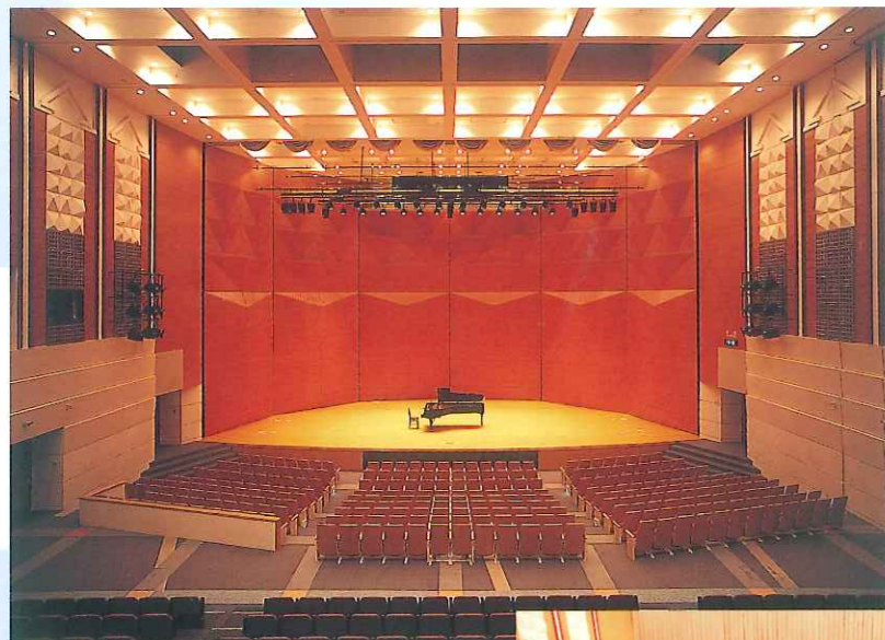
1 多目的ホール 各種講演会や催しに ご使用いただけます。